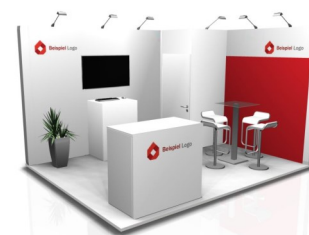
Option D | 650,- Euro pro m 2 Individualmessebau