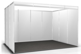
Option B | 450,- Euro pro m 2 Systemstand