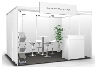
Option C | 550,- Euro pro m 2 Systemstand mit Mobiliar